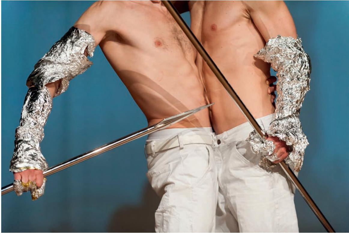
Tragedy of a Friendship