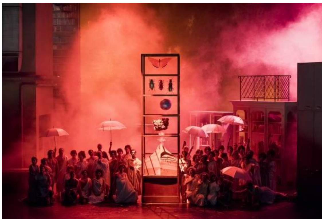
Pompéi au moment de l'éruption du volcan