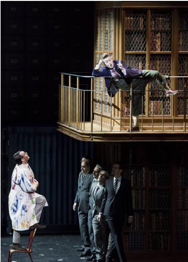
Robin-Luron en haut de la bibliothèque