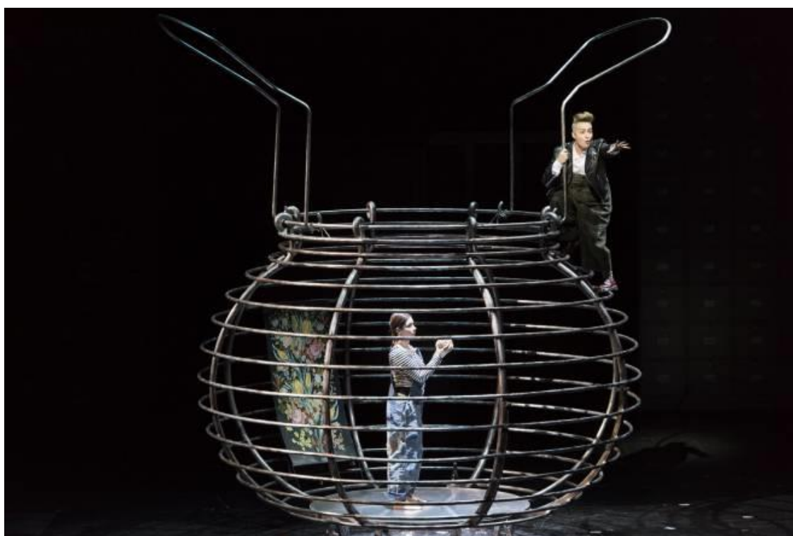
Robin-Luron vient délivrer Rosée-du-Soir de sa prison (une panier à salade !)