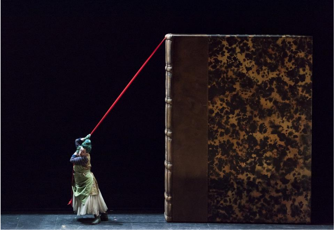
La sorcière Coloquinte amenant le livre de contes