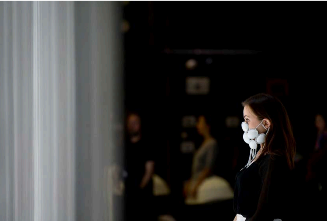
La Flûte enchantée ou le Chant de la Mère, Opéra de Lille, répétitions, avril 2019

chanté en allemand, surtitré en français +/- 3h10 entracte compris