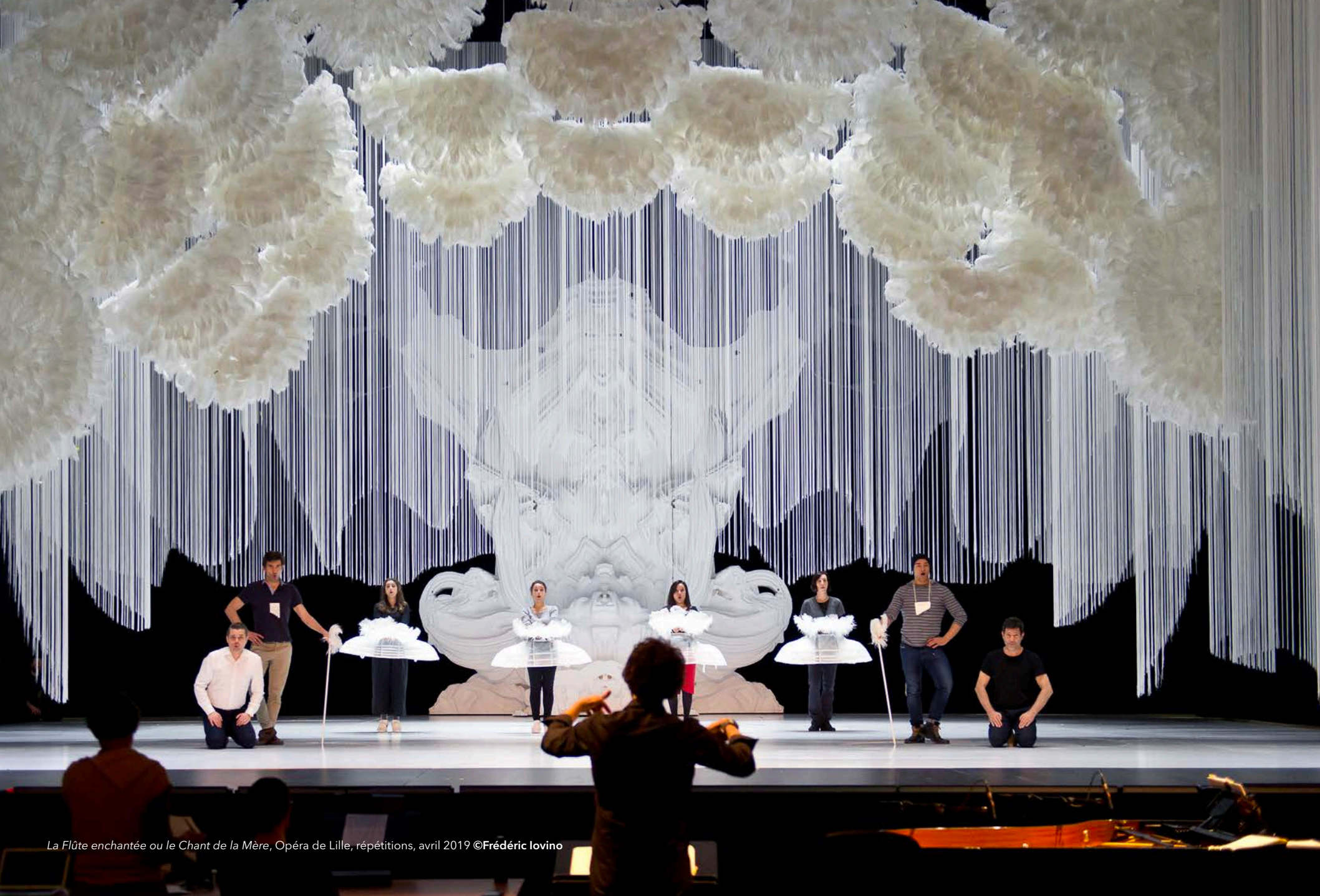
La Flûte enchantée ou le Chant de la Mère, Opéra de Lille, répétitions, avril 2019