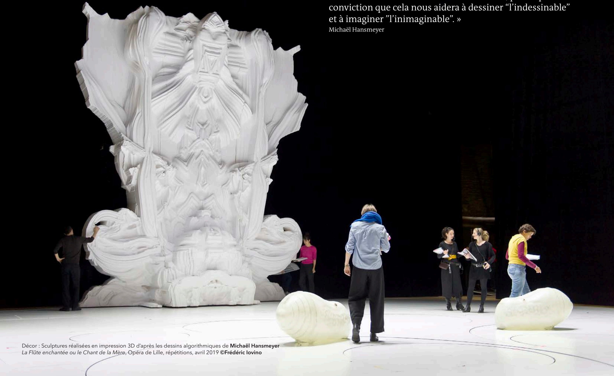
Décor : Sculptures réalisées en impression 3D d'après les dessins algorithmiques de Michaël Hansmeyer La Flûte enchantée ou le Chant de la Mère , Opéra de Lille, répétitions, avril 2019