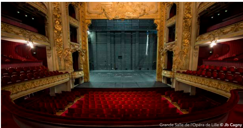
Grande Salle de l'Opéra de Lille

Accompagné d'un membre de l'équipe de l'Opéra de Lille, plongez-vous dans le décor monumental des Pêcheurs de perles , imaginé par le talentueux collectif flamand FC Bergman qui signe également la mise en scène.