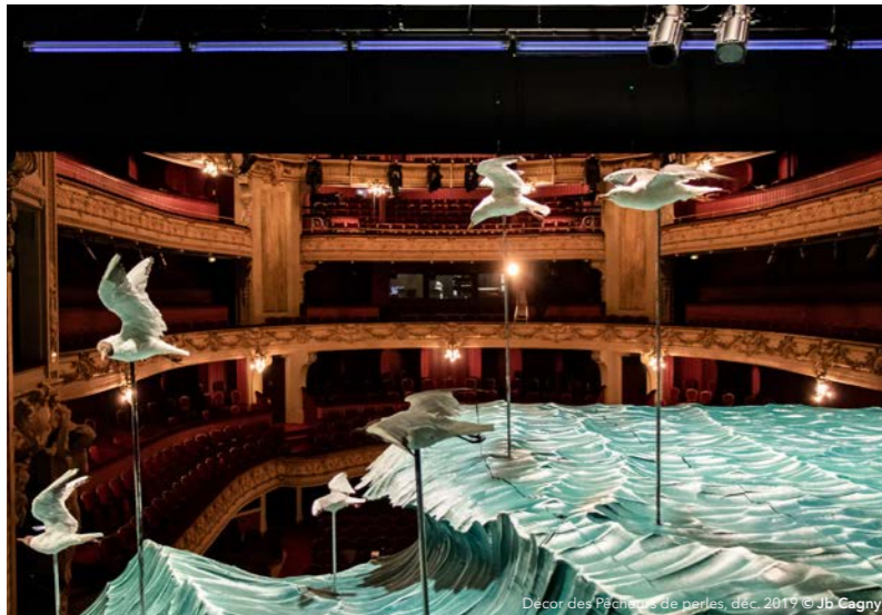
Décor des Pêcheurs de perles, déc. 2019

Ce samedi 1 er février, au cœur des Hauts-de-France, imaginez et rêvez l'Orient, de Bizet à aujourd'hui.