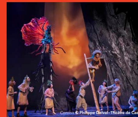
Coronis © Philippe Delval - Théâtre de Caen

programme complet et réservation sur opera-lille.fr