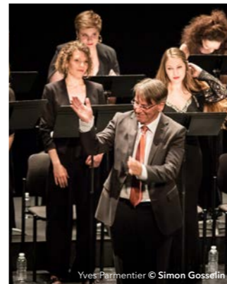
Yves Parmentier © Simon Gosselin