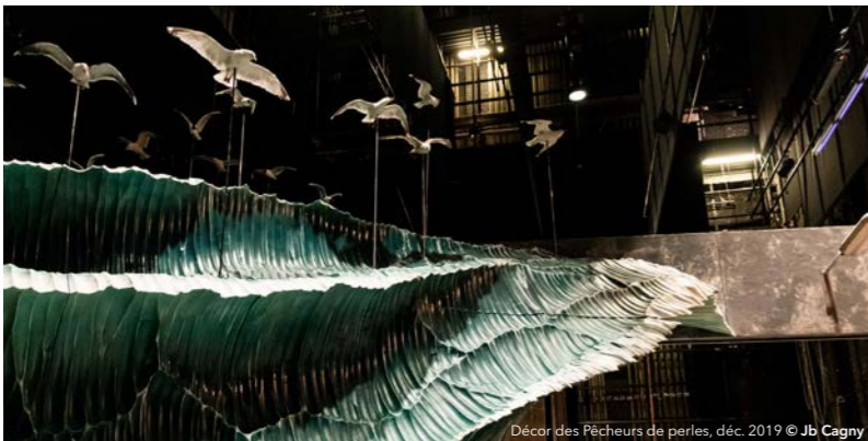
Décor des Pêcheurs de perles, déc. 2019