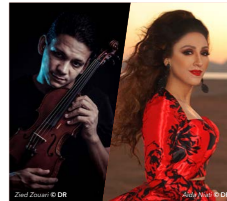
Zied Zouari