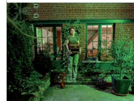
La Nuit tous les chats sont gris