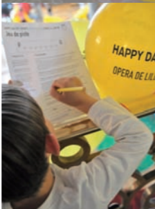
Jeu de piste