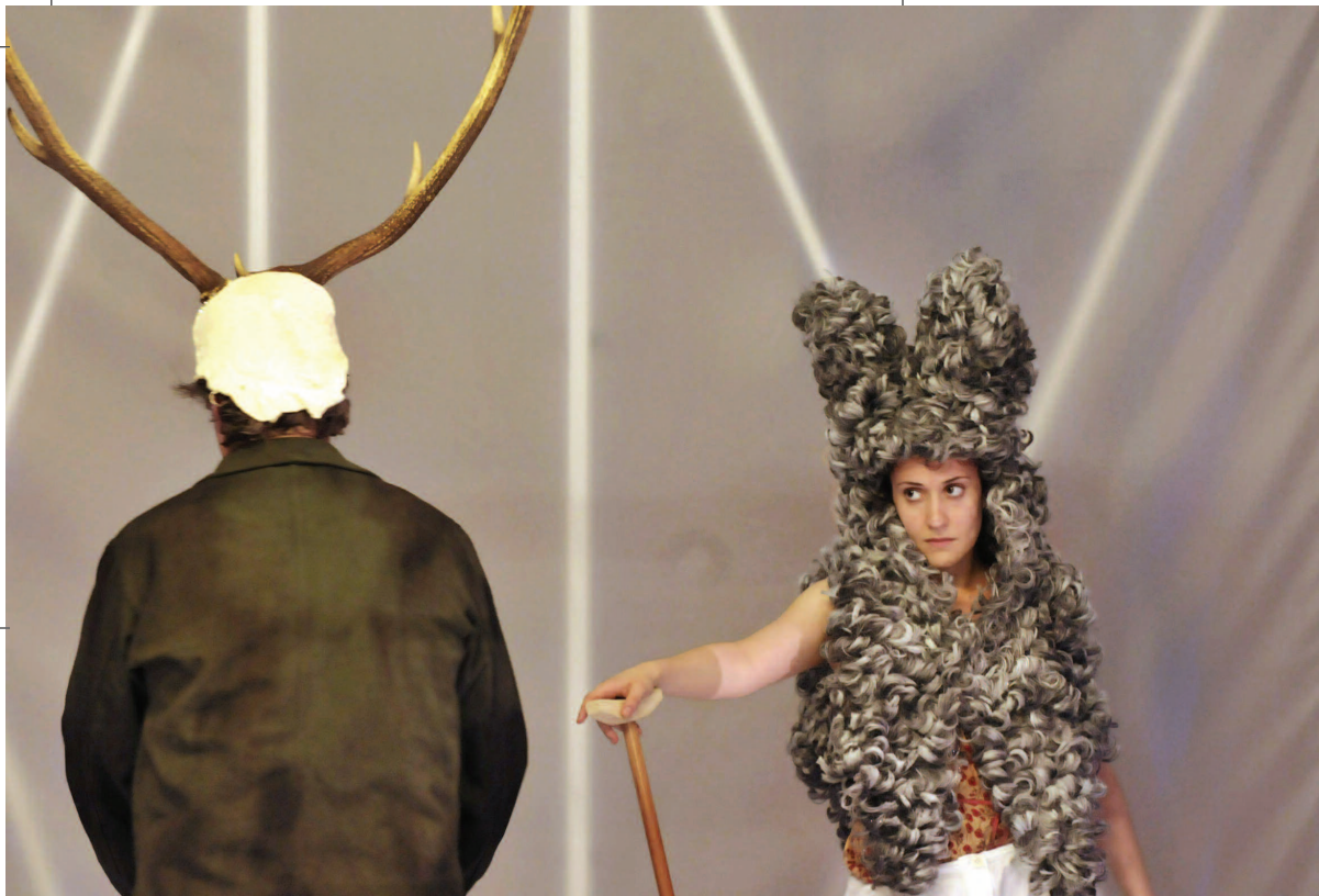
L'INFEDELTA' DELUSA