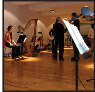
FOYER DE LA DANSE 4ème galerie (accès en 3ème galerie)