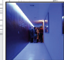
DESSOUS DE SCÈNE Accès par le hall d'entrée