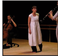
STUDIO 5ème étage (accès en 3ème galerie)