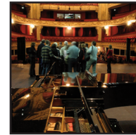
GRANDE SALLE Accès par le parterre