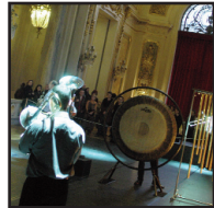
FOYER 1ère galerie