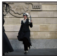
DEVANT L'OPÉRA Place du Théâtre