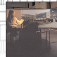
ROTONDE Accès par le hall d'entrée