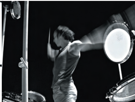
Compagnie Arcos, Echoa