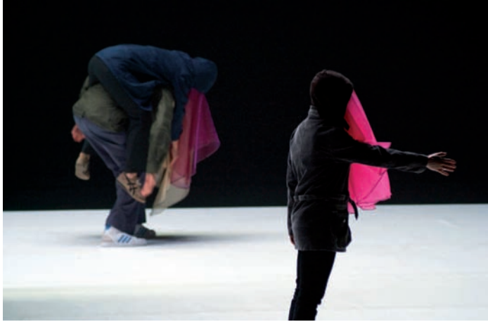
MON AMOUR (2008) – Photo : Frédéric Iovino