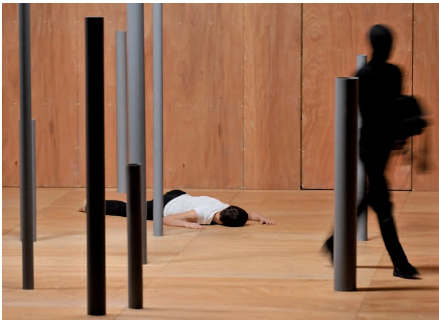
L'OUBLI, TOUCHER DU BOIS. (2010)