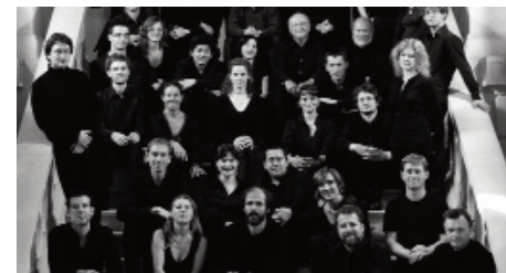
Le Concert d'Astrée

Haendel subit des attaques paralysantes et devient aveugle. Il meurt à Londres à l'âge de 74 ans, le 14 avril 1759 et est enterré à l'Abbaye de Westminster.